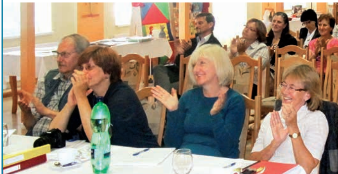
Odborná porota oceňuje potleskom tanečné vystúpenie žiakov miestnej základnej školy.