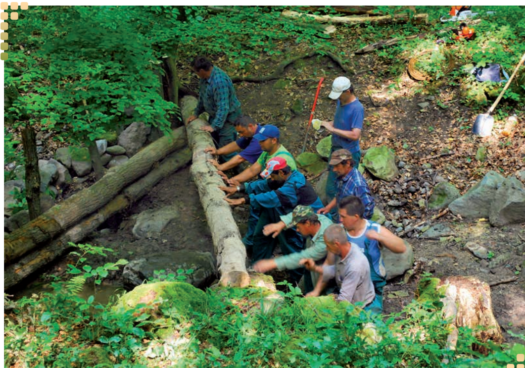
Bobríci v plnom nasadení.