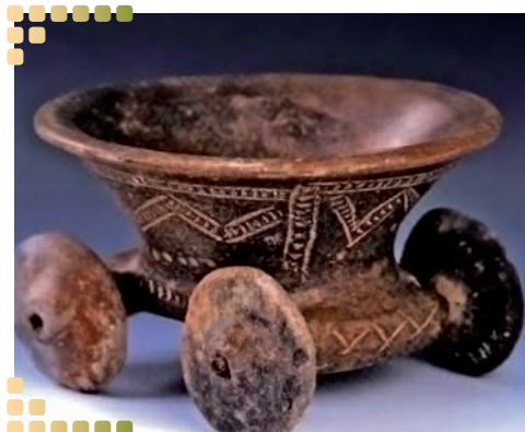
Hlinený vozík - archeologický nález z Nižnej Myšle z hrobu č. 40.