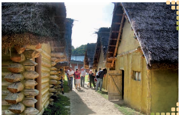
Pri prehliadke otomanskej osady.

Naši predkovia vyrábajú nádoby z bronzu.