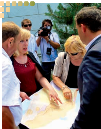
Nad mapou pod kostolom.

nika rovnakú otázku: Aké sú Vaše pocity? „Ludia sa trápia. Nemožno však očakávať, že každému, kto príde o dom, je vláda schopná v plnej výške zaplatiť výstavbu nového. Na