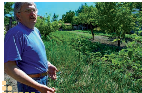
...a v jeho milej záhrade.

Pohrúžil som sa do práce. Zrazu čujem hukot, ako keď sa včely roja. Niečo veľké, úžasné, neskutočné! Celá záhrada včiel, zvuk ako z helikoptéry. Ako keby chceli zatieniť slnko. Vytvárali pred úľmi vzdušné chumáče. Čo sa deje? Vari rabovka? (vykrádanie úľa inou včelou rodinou - pozn. red). Dymím ich, striekam vodou. Nakoniec pozriem hore a vidím čierne mračná... Veď včely