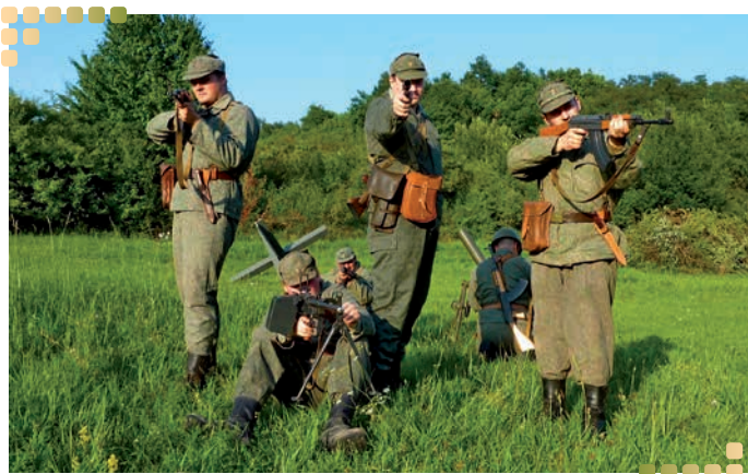
Účinkujúci boli zo Slovenska aj Poľska.

Zahanbiť sa nenechali ani šikovné ženy z obce. Unaveným vojakom aj civilistom prichystali prekvapenie. Pria-