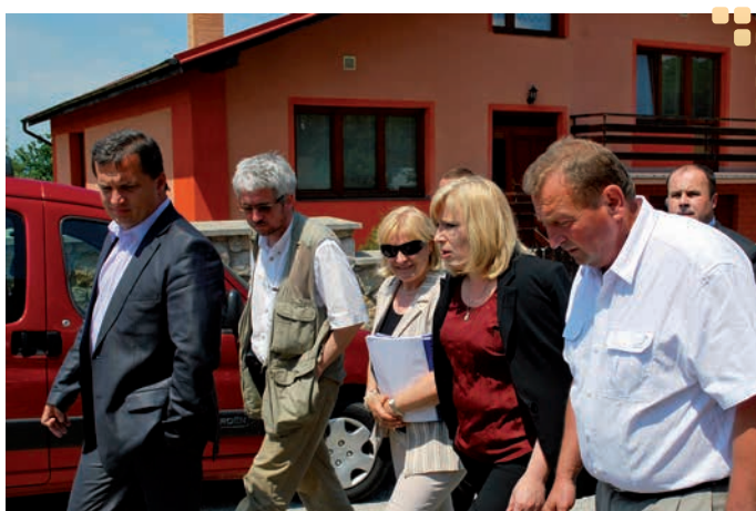
Zľava doprava: minister životného prostredia József Nagy, aktivista Andrej Bán, premiérka Ivetta Radičová, starosta Nižnej Myšle Ľudovít Grega.

Na stretnutí je tiež známy aktivista Andrej Bán. Zastupuje slovenskú pobočku organizácie Človek v tísni, Slovenskú katolícku charitu a Konferenciu biskupov Sloven-