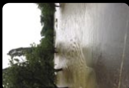
Vyšná Myšľa odrezaná od sveta v máji i v júni.