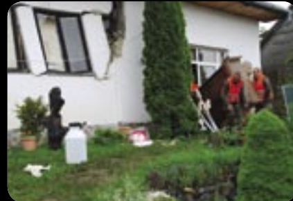
Dom za domom padá. Nižná Myšľa, 4. jún 2010.