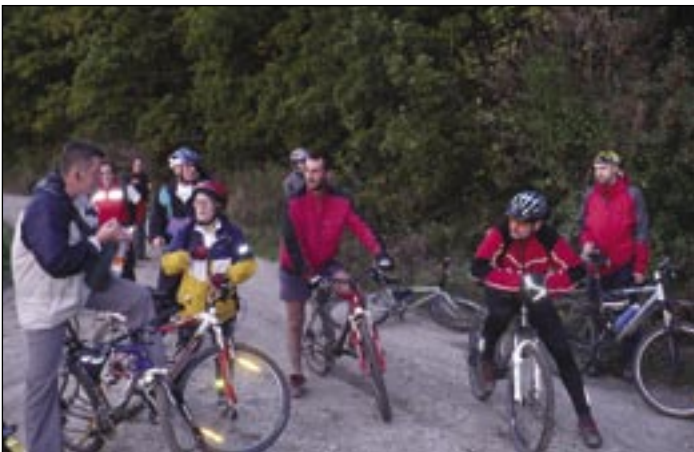
Budúca sezóna ponúkne cyklistom bohaté možnosti na výlety.