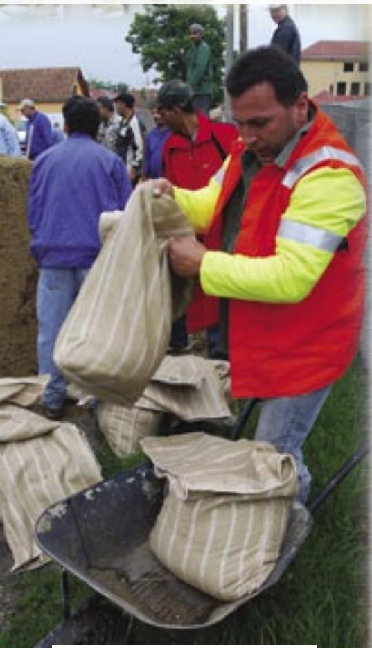
Pomáhal, kto vedel. Čaňa, 3. jún 2010.