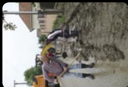
Ždaňa. Zápas s bahnom 3. jún 2010.