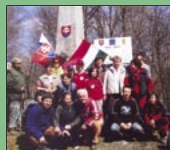
Na snímke časť účastníkov Pochodu priateľstva.