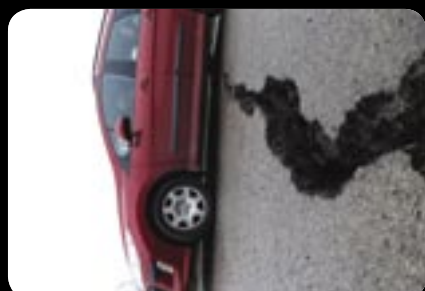
Ešte do Trsteného auto prešlo. 3. jún 2010.