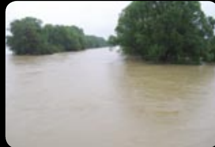
Kde je Hornád? 3. jún 2010.