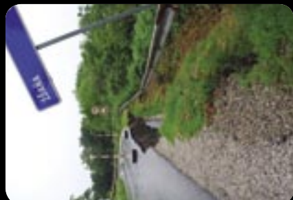
Cesta medzi Nižnou Myšľou a Nižnou Hutkou. 3. jún 2010.