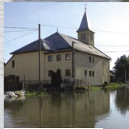
Čaňa, 6. jún 2010.