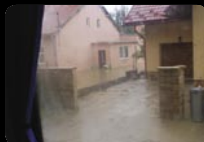
Pohľad z posledného autobusu, ktorý v čase povodní pustili.