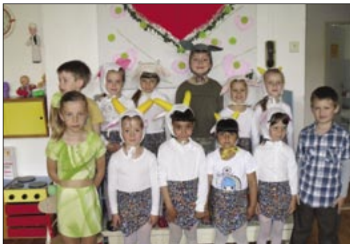
Usmiate kozliatka z Nižnej Myšle.