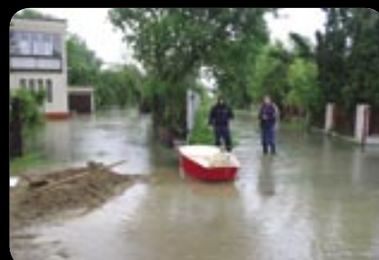
Na člne po čanianskych cestách a záhradách. 3. jún 2010.