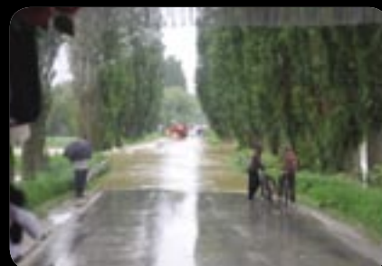
Čaňa - Ždaňa. Dva brehy. 3. jún 2010.