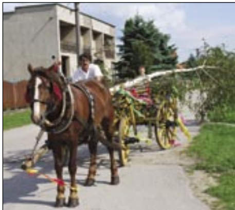
Máj priniesli na voze.