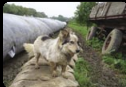
Momentka z Trsteného pri Hornáde. 3. jún 2010.