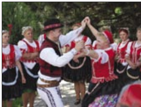
Po prekáračkách nasledoval tanec.

Viete, že v stredovekej Európe malo postavenie mája právny význam ako prísľub do manželstva? V čom vlastne stavenie májov spočíva? Poznali ho už v antike. Rímania a mnohé staroveké národy dávali pred 1. májom na domy a hospodárske budovy stromčeky na ochranu pred zlými duchmi a chorobami. V stredoveku mali úctu ku stromom. Máje stavali ako prejav úcty a žičlivosti pred kostol a radnicu. V Kokšove – Bakši si v predposlednú nedeľu piateho mesiaca v roku pripomenú túto obyčaj. Mládenec staval máj dievčaťu, o ktoré mal vážny záujem a chlapci všetkým dievčatám, ktoré dosiahli vek dospelosti. V tridsiatych rokoch 20. storočia tradícia postupne zanikla. Pred oslavami jubilea Bakšanov si obyčaj pripomenuli prekáračkami, sprievodom po obci, piesňami, tancami. Nakoniec Bakšane postavili máj pred kultúrnym domom všetkým dospelým dievčatám ako prejav hrdosti na predkov. red