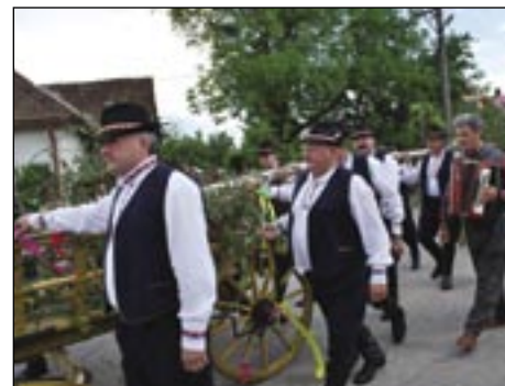
Bakšane v sprievode po obci.