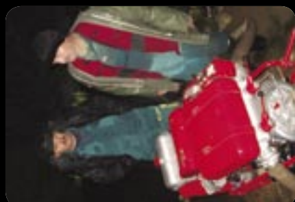
Hasiči v Košickej Polianke.