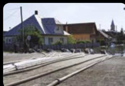
Čerpadlá jedno za druhým. Čaňa 6. jún 2010.