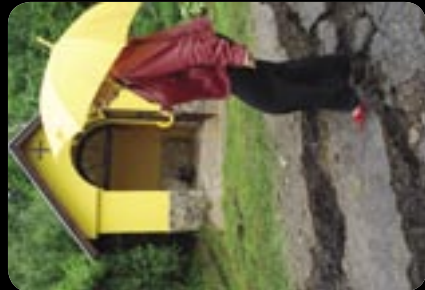
Nižná Myšľa. 4. jún 2010. Kaplnka zázračne nepoškodená.