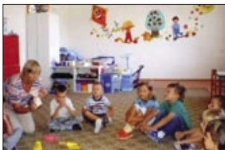
Dvadsať osem škôlkarov a šesťdesiatpäť školákov sa učí v nových priestoroch.

Nástup do školy pre deti z Nižnej Myšle bol významným historickým momentom. Po šiestich generáciách sa materská a základná škola presťahovali z bývalého jezuitskeho kláštora do zrekonštruovanej budovy niekdajšieho poľnohospodár-