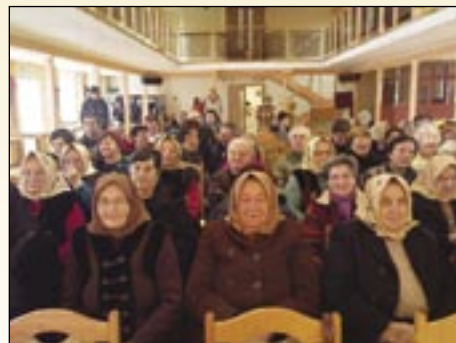
Dôchodcovia v Ždani si pozreli program detí.