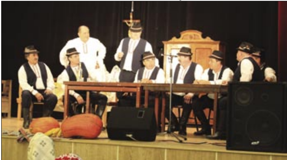
Bakšane počas Valalickej krojovanej parády.