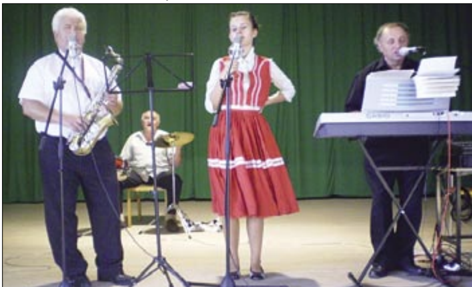
Skupina Orgován v akcii.