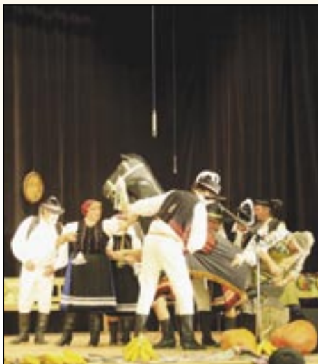
Valalickej krojovanej parády obyvatelia ukazujú tradície.