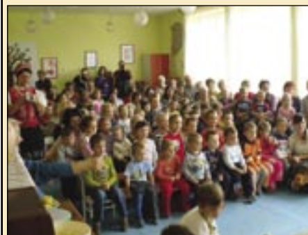
V Čani navštívili starí rodičia materskú školu.