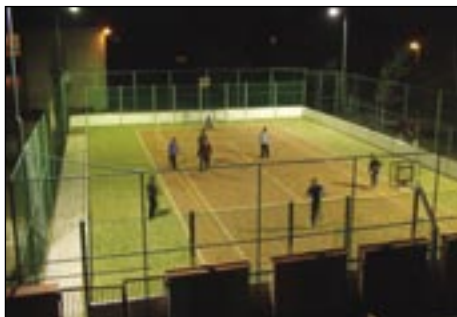
Futbalisti na novom multifunkčnom ihrisku s osvetlením v Košickej Polianke.