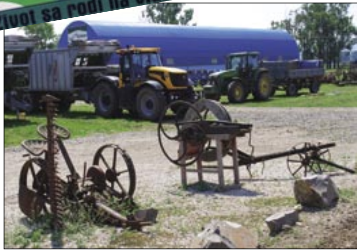
Polnohospodárstvo sa neustále mení. Vidno to i na strojoch. Teraz do popredia nastupuje agroenergetika.