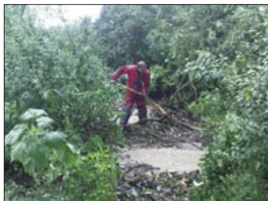
Voda spôsobí za niekoľko minút hotovú pohromu.

Katarína Šimková