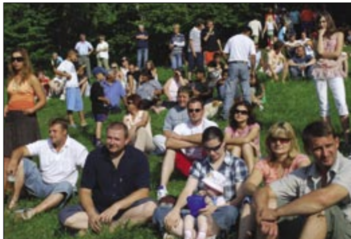
Aj tento rok bola na Dňoch mikroregiónu príjemná atmosféra.