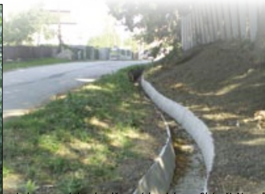
Jedna z nových odvodňovacích priekop v Skároši. Na veľké ochranné opatrenia však ešte čakajú.