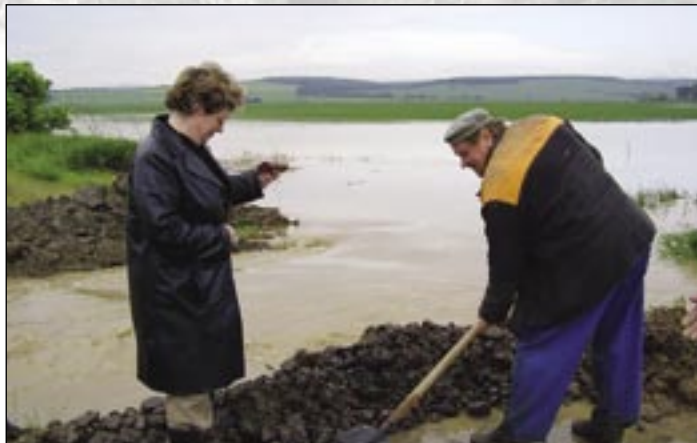
Záplavy vo Vyšnej Hutke v roku 2006.

„Na protipovodňovej ochrane by sa mala priebežne podieľať celá spoločnosť. Pre opakované zásahy spracová-