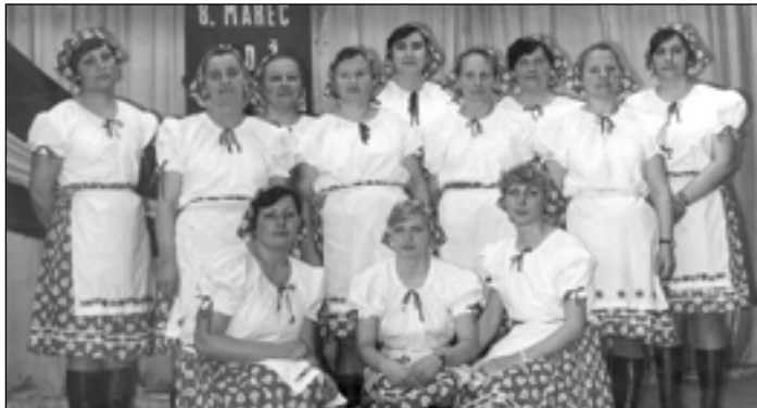
Skárošanka v roku 1979.