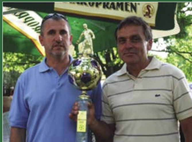
Spokojní čanianski futbalisti s trofejou.