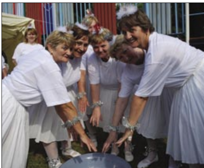
Odvážne ženy z Vyšnej Myšle vedia vždy prevkapiť. Tentoraz s Labutím jazerom (lavórom).

Odvážne tvorivé Odvážne ženy z Vyšnej Myšle si navčičili balet Labutie jazero. Hoci v zákulisí polemizujú nad dĺžkou sukne v súvislosti