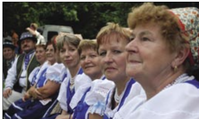
Domovina z Čane na Dňoch Regionálneho združenia obcí Hornád.