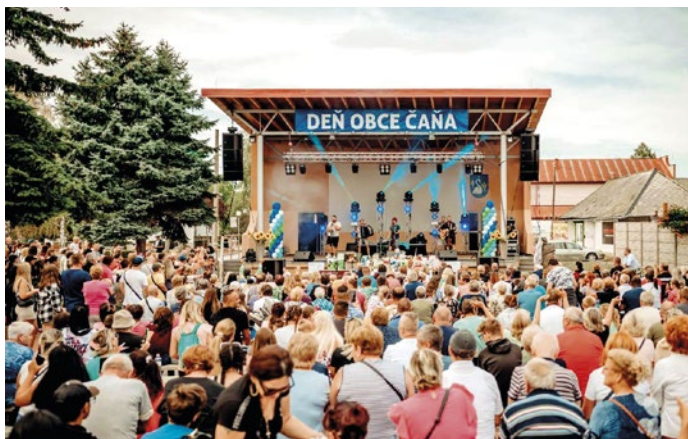
Zaplnené hľadisko si užívalo vystúpenia v amfiteátri Čane