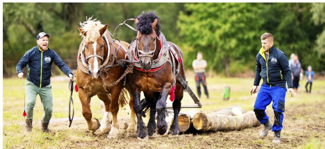
Furmani premiérovu súťažili vo Vyšnej Myšli (strana 14)