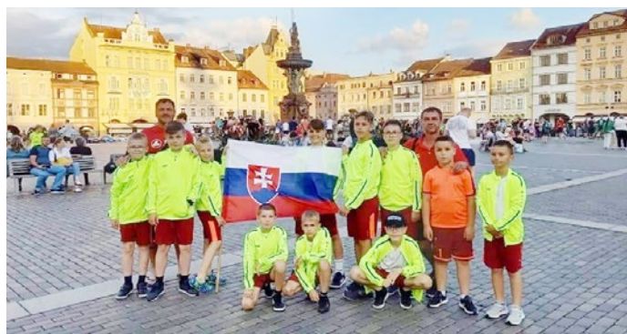
V Českých Budějoviciach preslávili klub z malej dedinky

Monika Floriánová