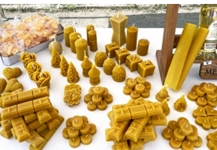
Vosk, nielen v podobe sviečok

Anton Oberhauser, foto archív Natálie Šivákovovej