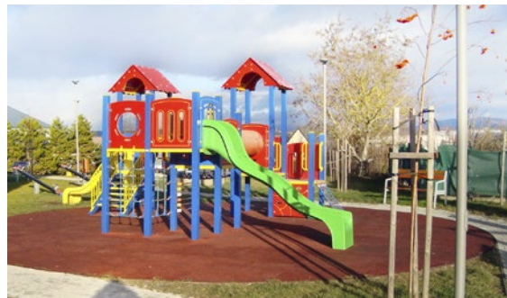
Detské ihrisko z projektu Budovanie prvkov zelenej infraštruktúry v Geči