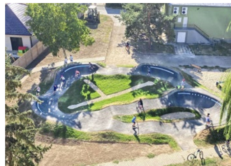
Pumptracková dráha v Ždani – prvá v obci Košického kraja