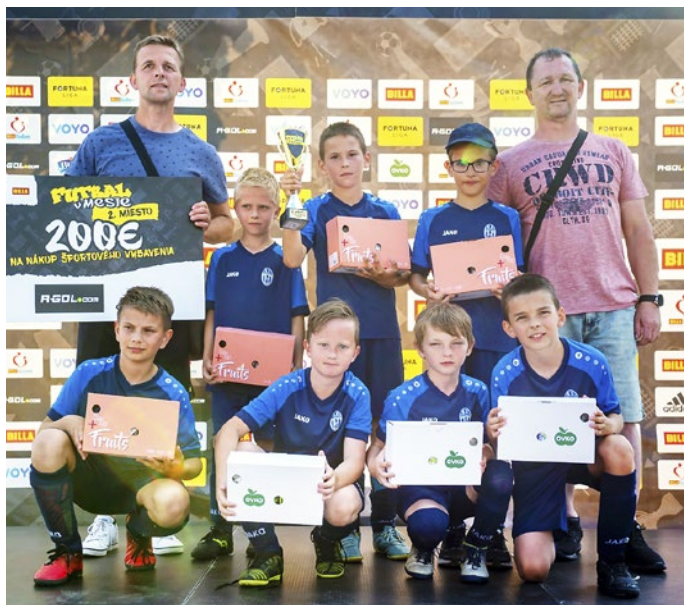
Výhra 200 eur na nákup športového oblečenia potešila

V augustovom finále 16 najlepších tímov U11 v Bratislave sa chlapi tešili len z jedného víťazného zápasu, ale dodnes nadšení spomínajú na vláčikový výlet po hlavnom meste, výhľad z hradu či na