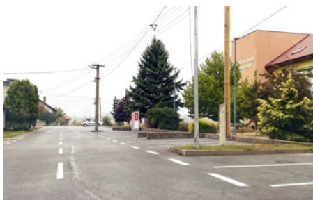
Bezpečnosť na cestách zvyšujú vodorovné značky