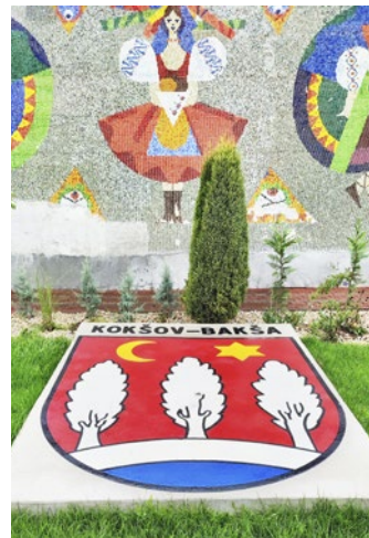
Kokšov-Bakša: pred kultúrnym domom pribudol erb obce

V najväčšej obci nášho regiónu vyšlo počas veľkého dňa všetko, vrátane počasia. Začiatok oficiálneho programu patrilo kladeniu vencov na čanianskom cintoríne pri Pomníku padlým v SNP. Počas dňa sa mohli