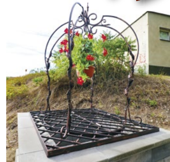
Nová dominanta Vyšnej Myšle

vhodiť do studne, alebo si ho zobrat so sebou ako dôkaz svojej lásky,“ približuje starosta, ktorý nápad dotiahol do detailov. Sen o studni lásky mu pomohli zrealizovať zamestnanci obce s podporou poslancov obecného zastupiteľstva.