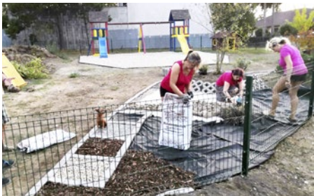
Z prác na detskom ihrisku Pevnosť Belža. Od septembra 2022 už slúži malým aj veľkým