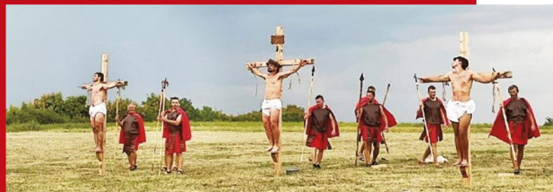
Hraná krížová cesta vyrážala dych