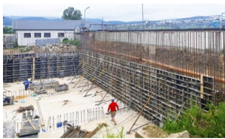
Z prác na stavebnej časti ČOV Čaňa, rok 2020