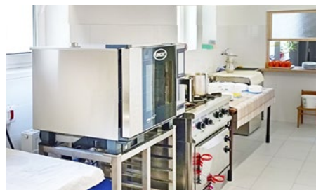
Rekonštruovaná kuchyňa MŠ v Gyňove