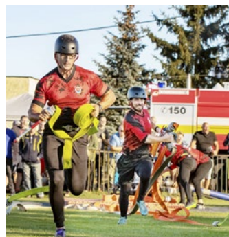
Tím Kokšova-Bakše vo finále KEHL

Majú za sebou prvé územné súťaže mladých hasičov do osem rokov - v júni v Čečejovciach a v septembri v Drienovci, kde sa im podarilo