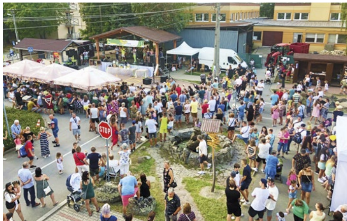
Na Ždanianskom jarmoku sa to hemžilo ľuďmi