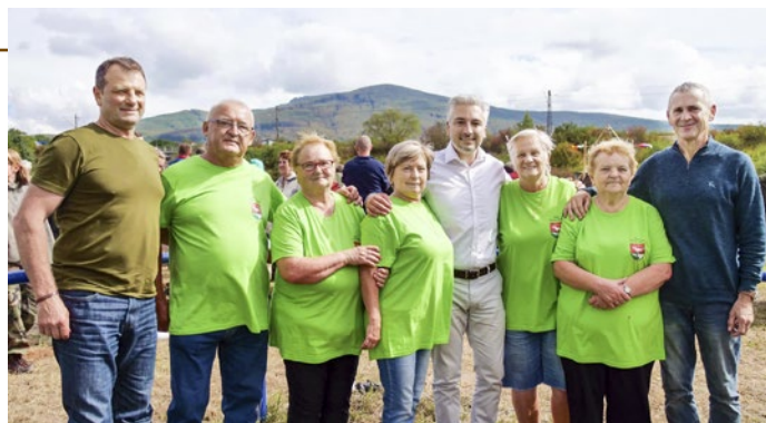
Organizačný tím pripravil občerstvenie na baloch zo slamy

Slovo dalo slovo, s vedením Asociácie furmanov Slovenska (AFuS) dohodli termín 10. september a s dobrovoľníkmi pripravili všetko potrebné – drevo, ohrady, rampu, ceny pre furmanov, ovos a vodu pre kone, občerstvenie atď. Nakoniec množstvo divákov obdi-