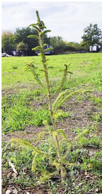
O malé stromčeky sa dobre starajú

Monika Floriánová