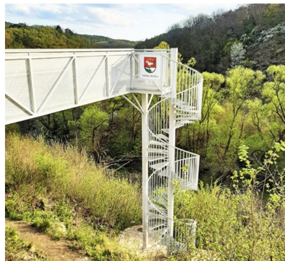
Myšľianska vyhládka láka návštevníkov k nám