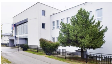
Priečelie obecného úradu vyzerá reprezentatívne

Najväčšou akciou, čo do rozpočtu a rozsahu stavebných prác, bola rekonštrukcia kultúrneho domu a obecného úradu. Spočívala hlavne v znížení energetickej náročnosti stavby, okrem zateplenia sme nainštalovali solárne panely a tepelné čerpadlo na ohrev vody.