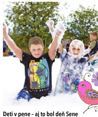
Deti v pene – aj to bol deň Sene