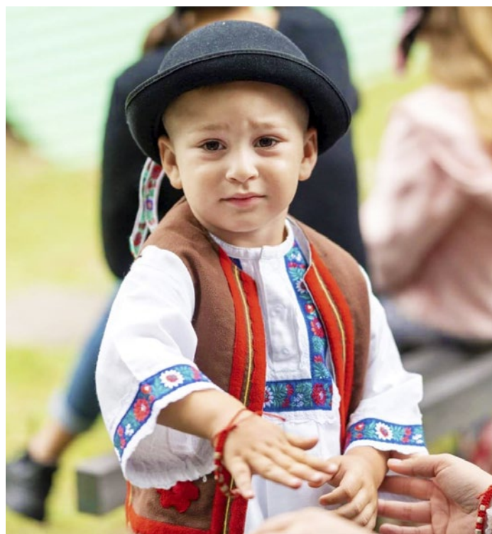
Mladučký účastník Abovských folklórnych slávností v Skároši (strana 2)