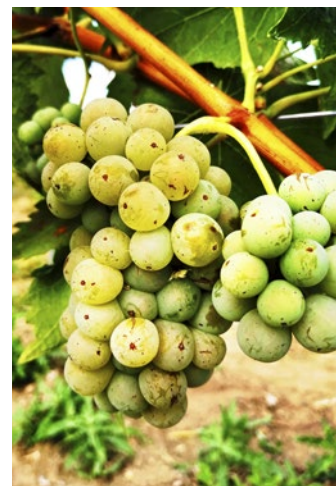
...prináša prvé strapce