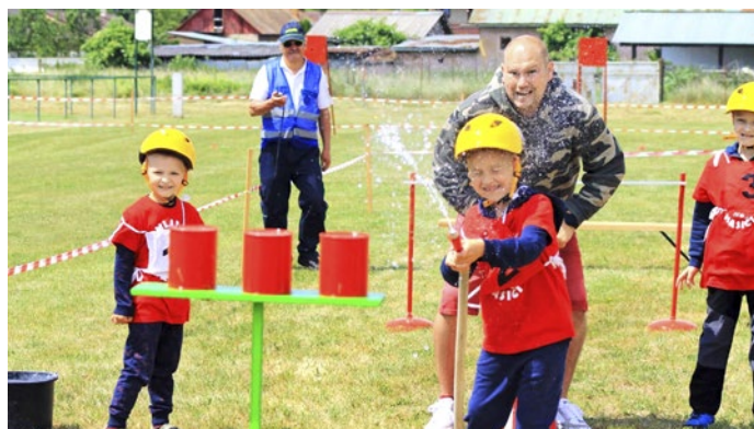
Pri najobľúbenejšej disciplíne