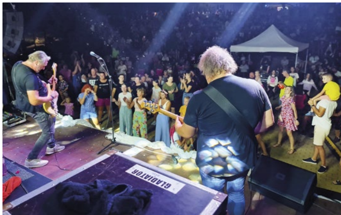
Za Gladiatorom prišli do Hanisky fanúšikovia až z Košíc