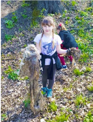
Malá brigádnica vo Vyšnej Myšli

Tento medzinárodný deň si v rámci úlohy v Recyklohách pripomenuli aj v ZŠ Ždaňa. Pozbierali smeti a vyčistili chodník medzi Ždaňou a Čaňou, aj príľahlé okolie. Túto trasu využívajú chodci i cyklisti denne, nazbierajú