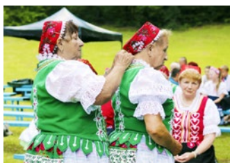
Posledné úpravy a hybaj vystupovať!

PZ Domaška od piatej rána navarilo 300 litrov guláša z diviny. Vážne konkurovali druhej partii poslancov zo Ždane, ktorý použili do svojho kotla mix bravčového a hovädzieho mäsa. Tajnú ingredienciu však neprezradil ani jeden