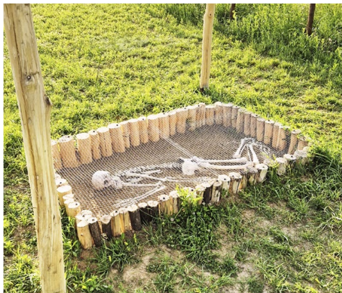
Otvorený hrob ako exponát v skanzene

Anton Oberhauser, foto archív Coll. Myssle