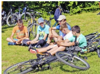
Na pešo či bicykli dorazili diváci na program

Jazvec, jeleň, veverička, sojka... prírodu a lesnú zver nám poľovníci z PZ Domaška priniesli priamo na pódium. Tento rok sú oslavy 18. ročníka Dní RZOH výnimočne spojené so strážcami lesa.