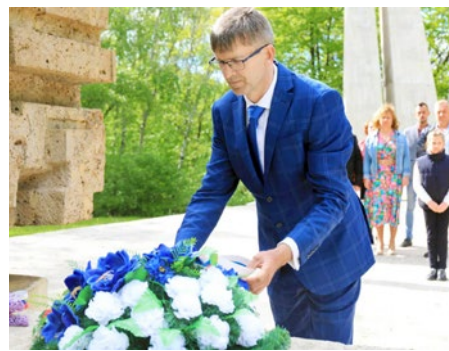
Starosta Skároša pri kladení venca