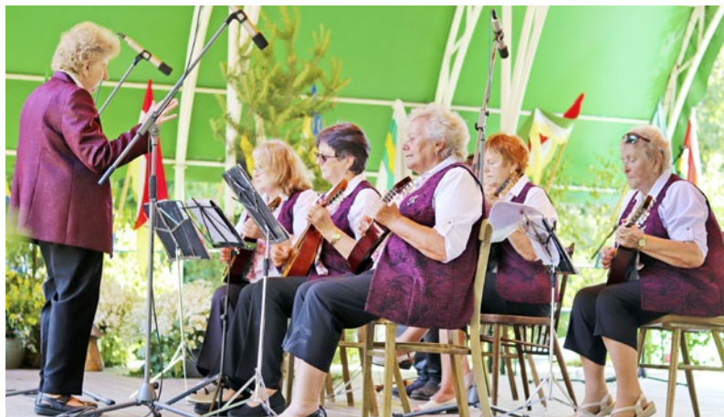
Zvuk mandolín Rjabinušky krásne vynikol. Ak sa vám táto hra páči, pridajte sa ku skupine, noví členovia sú vítaní