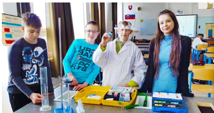
V chemickej učebni

Financie z verejných zdrojov umožňujú, aby v školách napredovalo 21. storočie. Na Základnej škole v Čani už prebieha vyučovanie žiakov 2. stupňa v odborných, tematicky zameraných učebniciach. Súčasťou ich výbavy sú učebnice a pracovné zošity, ktoré si tak chlapci a dievčatá nemusia nosiť do školy.