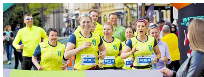
Nižnomyšľianska štafeta v cieľovej rovinke