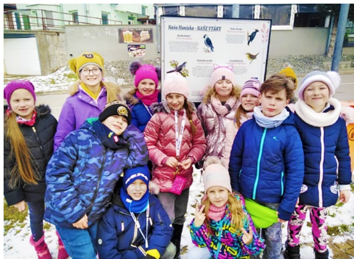
Školáci spoznávajú vtáčky na prechádzkach