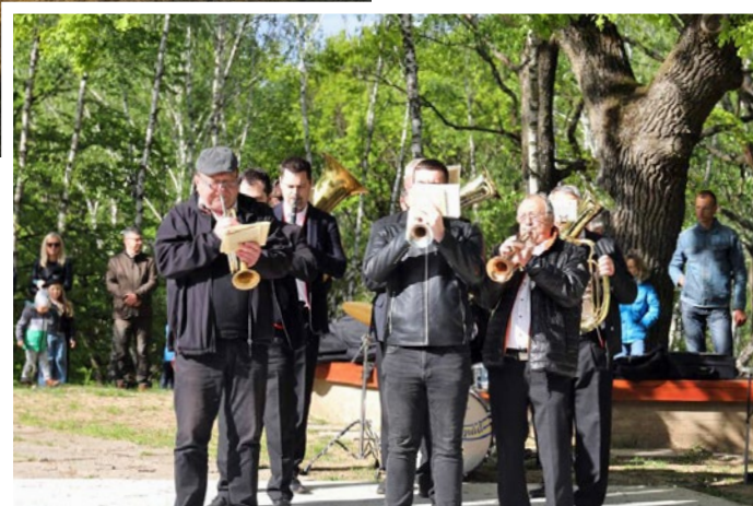
Dychová hudba dodala spomienke v Skároši dôstojný ráz