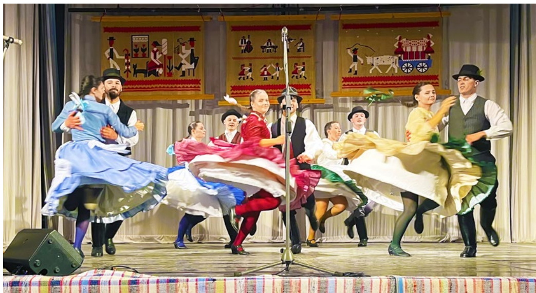
Vo víre tanca

Okrem poskytnutia kultúrneho domu pomohla obec so stravovaním a ubytovaním časti účastníkov, tiež s propagáciou festivalu. „Organizácia pre 180 ľudí bola náročná, ale na prípravu sme mali tri mesiace, takže sme to zvládli. Osobitne si tanečníci a speváci pochvalovali pohostinnosť