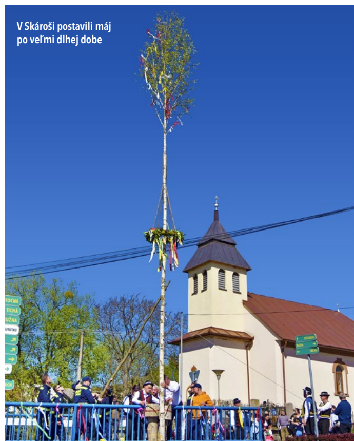
V Skároši postavili máj po veľmi dlhej dobe

Čaniansky folklórny festival - 1. ročník