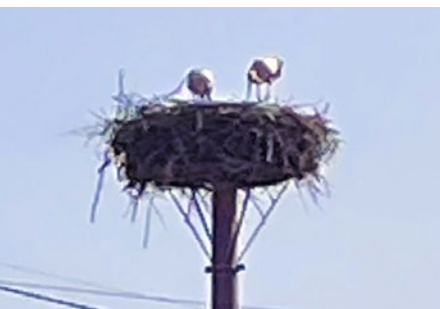
Párik v Seni

- prvý pár priletel 14. marca do Trsteného pri Hornáde,