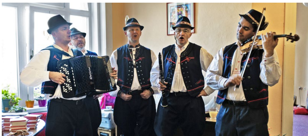
Namiesto ťukania do klávesníc redakčných počítačov znie muzika a spev Bakšanských Parobcov