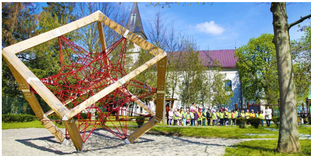
Zaujímavý prvok láka všetky deti