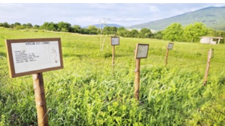
Návštevníci majú k dispozícii množstvo informácií o hroboch